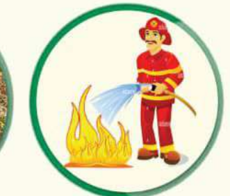
काम सकिएपछि आगो निभाउने