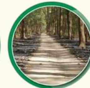
वन व्यवस्थापन र अग्नी रेखा निर्माण