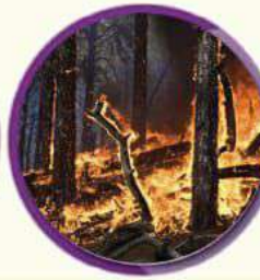
जैविक विविधतामा हास