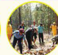
विपरीत दिशाबाट नियन्त्रित आगो लगाउने