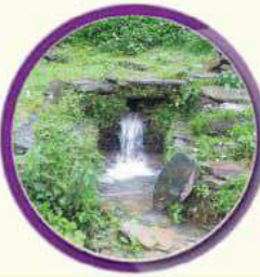
पानीको मुहान सुक्दै जानु