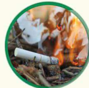
चुरोटको टुटा, सलाईको काँटी निभाएर फाल्ने