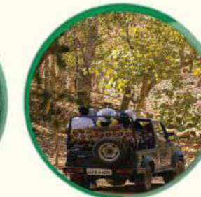
वन डढेलो अनुगमन र पहिचान गर्ने