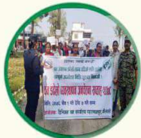
जनचेतना तथा प्रचार प्रसार