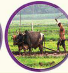
कृषि उत्पादनमा कमी