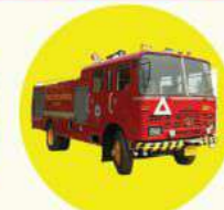
दमकलको व्यवस्थाका लागि पहल गर्ने