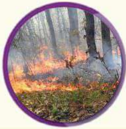
रुखविरुवा तथा वन्यजन्तुमा क्षती