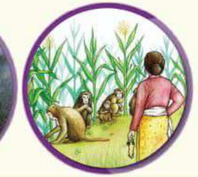
मानव वन्यजन्तु विचमा द्वन्द्व