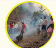
स्थानीय स्याउला, भान्सा पात को प्रयोग गरेर निभाउने