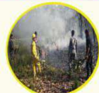
नजिकको वन वा प्रहरी कार्यालयमा खबर गर्ने